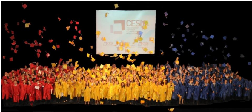
Remise de diplômes du Cesi

C'est autour du projet BENEFITS et plus précisément de la recherche en entrepreneuriat que s'est axé mon travail. Le projet étant franco-britannique, j'ai passé un mois à Paris, et un mois à Greenwich près de Londres.