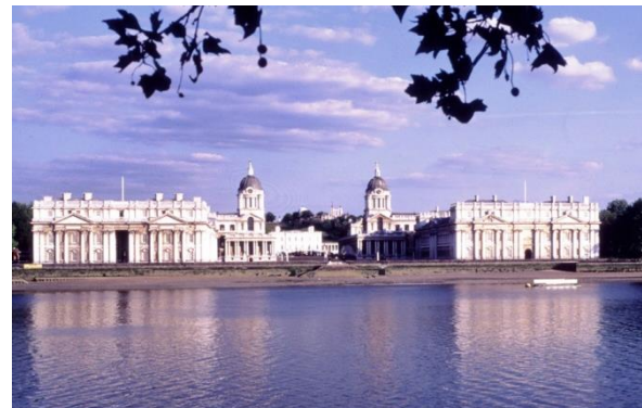
Le campus de l'Université de Greenwich